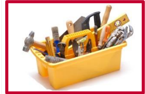
Actualizaciones y Reemplazo de Sistemas de Edificios