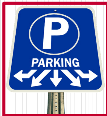
Actualizaciones de Instalaciones