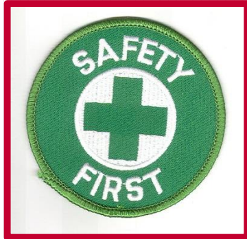
Proyectos de Seguridad