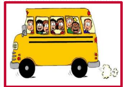
Transportación de Estudiantes